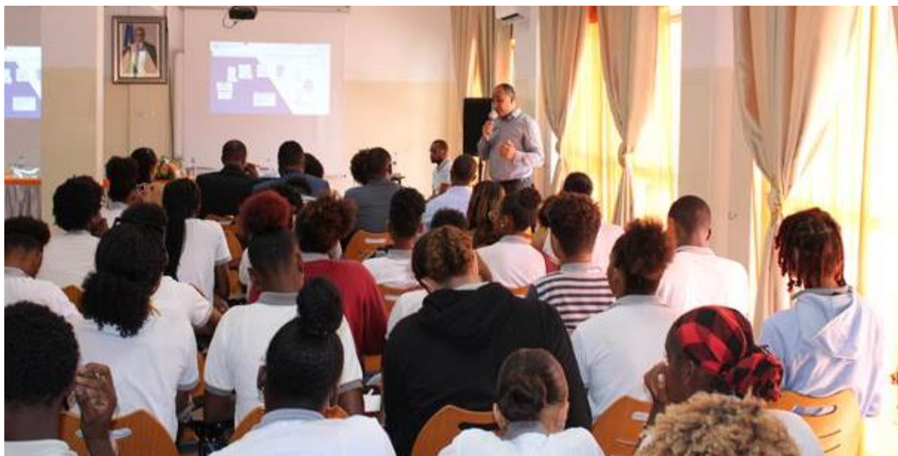
VII ação pedagógica na ESAD

Utilizou ainda o ensejo para anunciar para 2024, o lançamento do prémio CPC- Ciência, em que os alunos das escolas primárias, secundárias e das universidades podem concorrer com desenhos, textos e monografias de licenciatura e pós-graduação sobre a luta contra a corrupção, a ética e a integridade na sociedade.